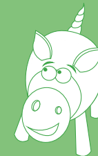
Les 4 pattes